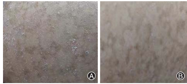
图 2 干细胞治疗前(A)、1 周后(B)患者皮损情况。A 为治疗前,皮损面积较大,上覆较多鳞屑;B 为治疗后,皮损面积明显较小,鳞屑显著减少

银屑病是一种多基因遗传背景下免疫介导的慢性、复发性、炎症性皮肤病,全球患病率约为 2% [1] 。银屑病的特征主要是以多种免疫细胞浸润为基础的持续炎症引起的角质形成细胞的过度增殖和分化异常,主要表现为局限或泛发的鳞屑性红色斑块,可伴关节炎等系统性损害 [2] 。肝脏炎症和免疫反应已被认为是肝硬化发病机制的关键因